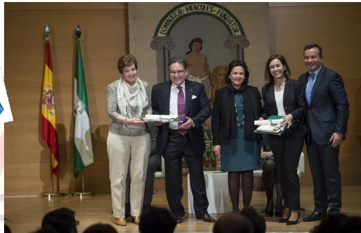
© Acto de entrega de la Bandera de Andalucía 2016