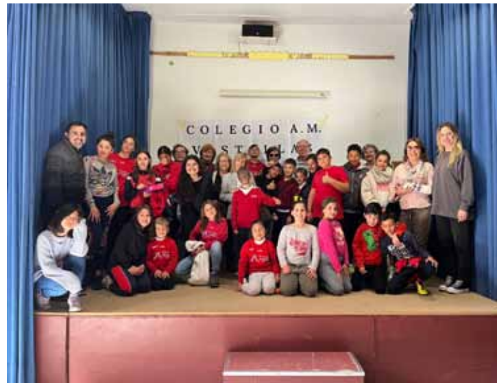
Participantes en el salón de actos del colegio

En este contexto de colaboración se llevó a cabo el pasado 14 de marzo, la siguiente actividad Intergeneracional: DIÁLOGO EN TORNO A LOS VALORES DE UNA OBRA TEATRAL.